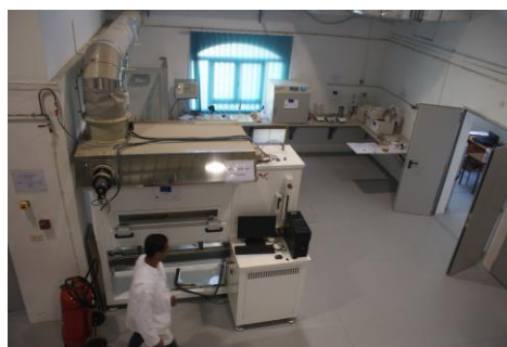
Laboratoire Réaction au feu du CTMCCV