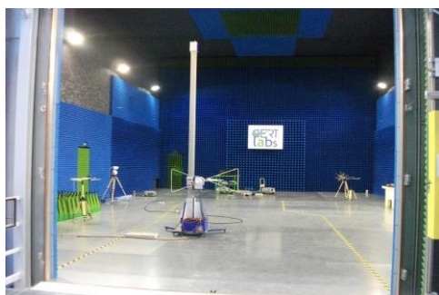
Laboratoire CEM du CERT- Unique en Afrique

Les investissements en matériel totalisent un montant de 6.5 M€ et englobent essentiellement l'acquisition et la mise en œuvre de laboratoires de compatibilité électromagnétique (CEM), des laboratoires basse tension (BT), des laboratoires photovoltaïques, des laboratoires de réaction au feu, des laboratoires de la marque ciment.